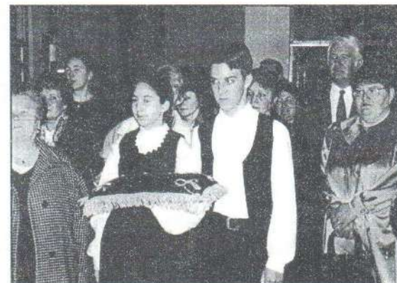
Házavatás előtt a jászfényszarui civil egyesületek

A rendezvény a fényszarui iskolások műsorával, az Iglice és a Borostyán táncosainak bemutatójával zárult.