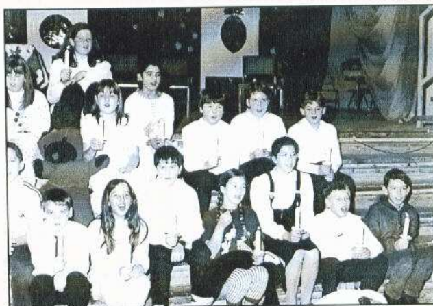
December 18-án, hétfőn a művelődési házban tartották meg az iskolai Ki mit tud?-ot. Felvételünkön a 6. c osztályos gyerekek láthatók, akik karácsonyi történetet adtak elő angol nyelven.