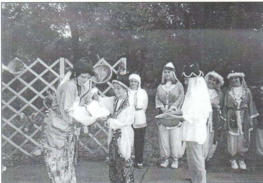
Ezzel a felvétellel kívántuk illusztrálni, hogyan teltek napjaink az idej regetáborban.

A Jászfényszaru Drámapedagógiai Műhely továbbra is vár programjaira és tagjai sorába minden hasonló gondolkodású érdeklődőt! Tervezett rendezvényeinkből néhány programot szeretnénk az újság olvasóinak figyelmébe ajánlani.