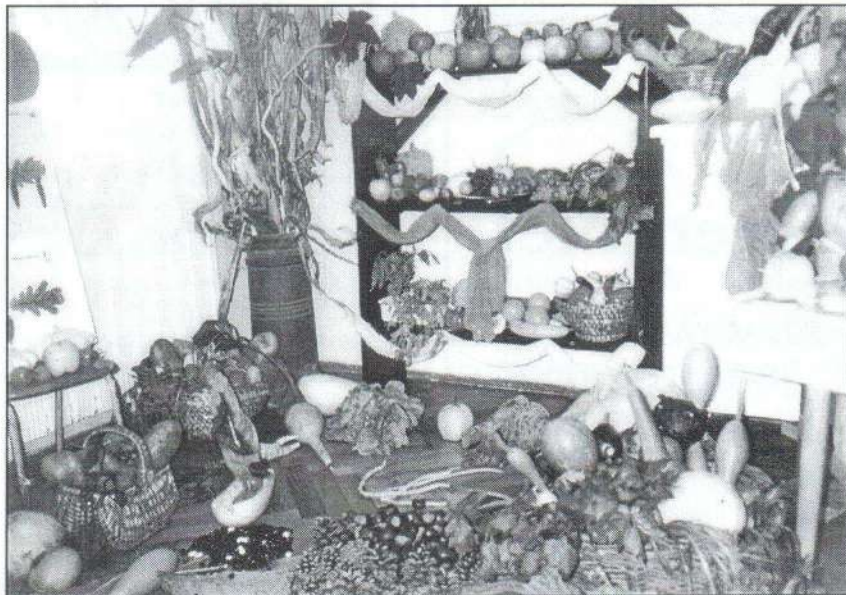
A II. Számú Óvodában szeptember 28-án rendezték meg a hagyományos őszi zöldség-gyümölcskiállítást. (A fényképet kölcsönkaptuk.)