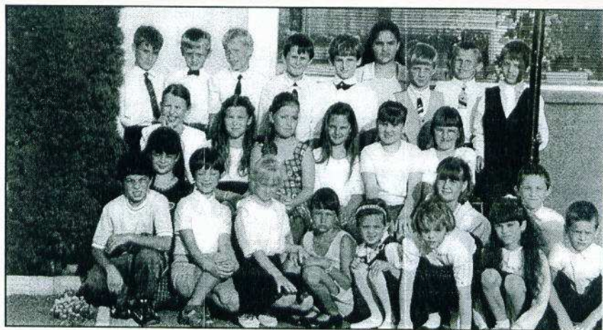
Az alsó tagozatos gyerekek