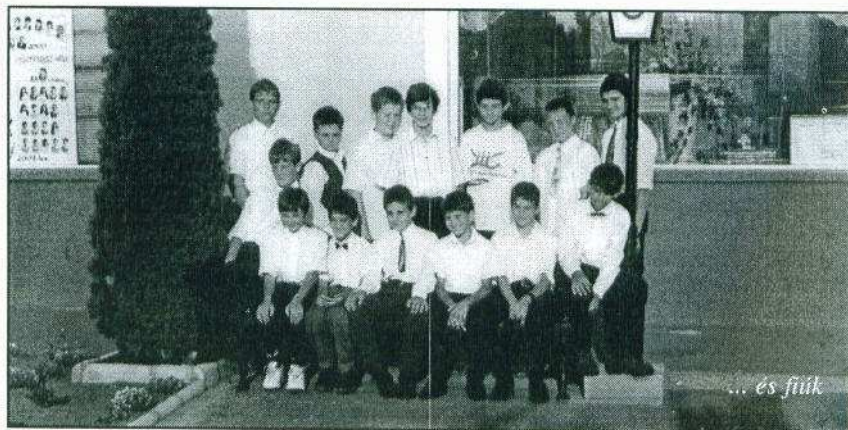
... és fiúk