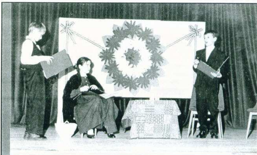
Az ünnepi műsor egy emlékezetes produkciója. A Petőfi szülei című jelenet szereplői.