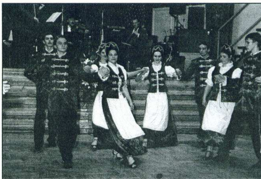
Február 19-én a VII. FÉBE-bálon palotást mutattak be a Borostyán táncklub tagjai. A rendezvényről későbbi lapszámunkban tudósítunk.