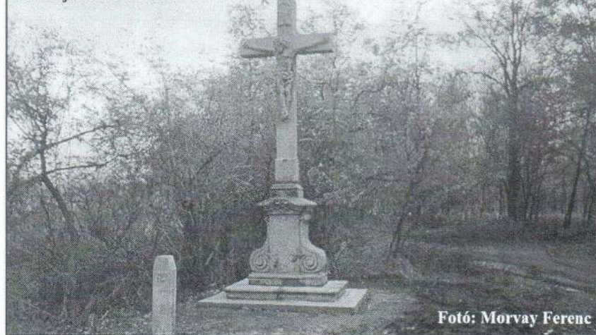
A felújított kőkereszt.