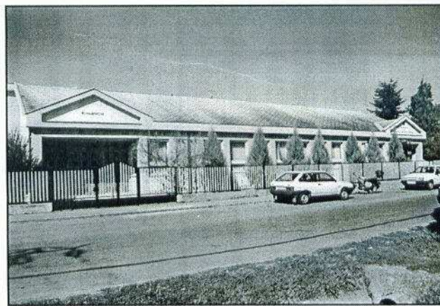
A fotó Újszászról érkezett

Az érettségizettek a középfokú szoftverüzemeltető, valamint a szállítmányozási technikus, a vasútüzemvitel-ellátó, vagy az ügyintéző titkár szakképzéseink közül választhatnak. Szakmunkás végzettségüket két éves nappali képzésben készítjük fel érettségire.