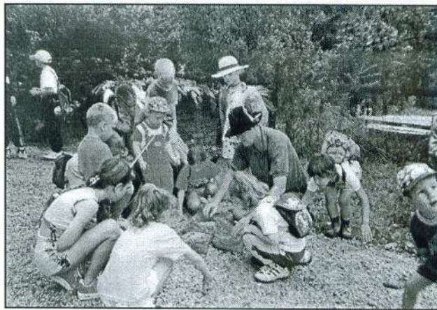
A „megtörtött” gabona vizsgálata

- A falu legényei elsajátították a csúzli-gyártás fortélyait és kiképzés után fegyverviselési engedélyt kaptak.