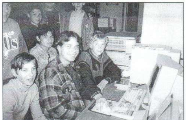
INTERNET SZAKKÖR AZ ISK. ÉS GYKÖNYVTÁRBAN (Ezt a fotót kölcsönkaptuk. A szerk.)

Sajnos az egy gép kevés ahhoz, hogy mindazon diák, aki már ismerkedik tanóra keretében a számítástechnika alapjaival, rendszeresen alkalmazhassa az INTERNET nyújtotta lehetőséget. Éppen ezért már több éve pályázunk különböző fórumokhoz, hogy szélesíthessük a felhasználók körét. Szeretnénk elérni, hogy diákjaink megtanulják a gyors információhoz jutás eszközeinek magabiztos, gyors és szakszerű használatát.