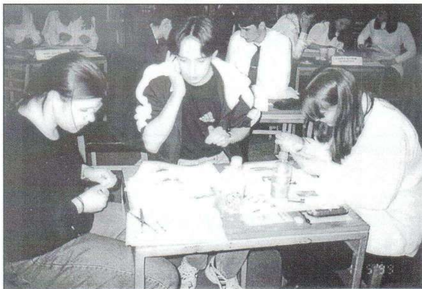
Redemptusok jászfényszarui örökösei Kiskunhalason

Kiskunhalas Város Önkormányzata és a História Kör „Redemptusok örökösei” címmel középiskolás korosztály részére történelmi vetélkedőt hirdetett meg. A szellemi erőpróbát a Kiskunhalasi Városi Könyvtárban május 1-jén a Város Napján rendezték. A hajdani hármaskerületből 8 csapat mérte össze tudását. A Jászságot