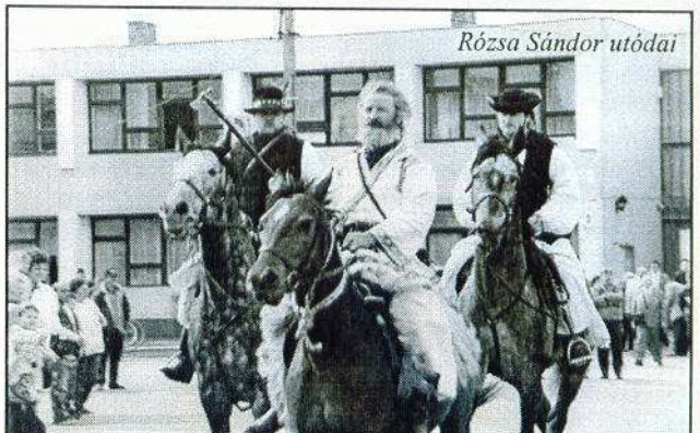
Rózsa Sándor utódai