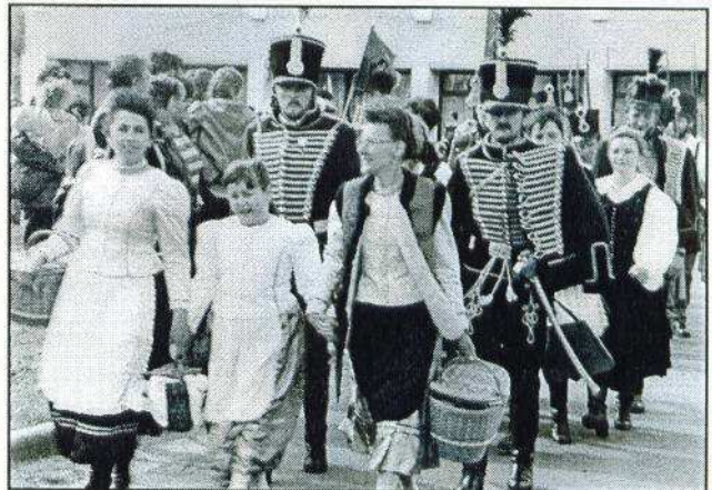
Indulás a csatamezőre gyalog...