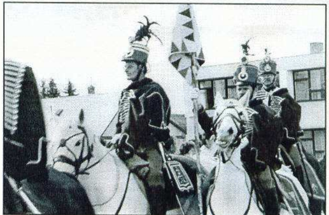
... és lóháton. A Balatonfelvidéki Radeckzy Huszárezred katonái.