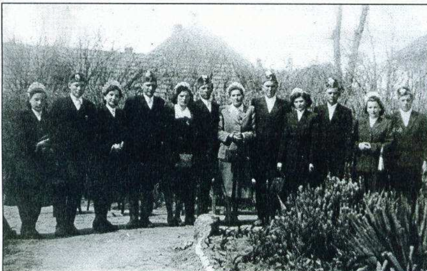
Ez a fénykép 1952 Húsvétján készült a Plébánia udvarán. A Jézus sírját őrző kardoslegényeket és fákyás lányokat ábrázolja. A fotót Langó Zoltánné (Dobó K. u.) küldte be. Köszönjük.