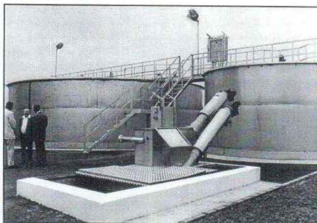
A kivitelező teendője még a tartályok hőszigetelése