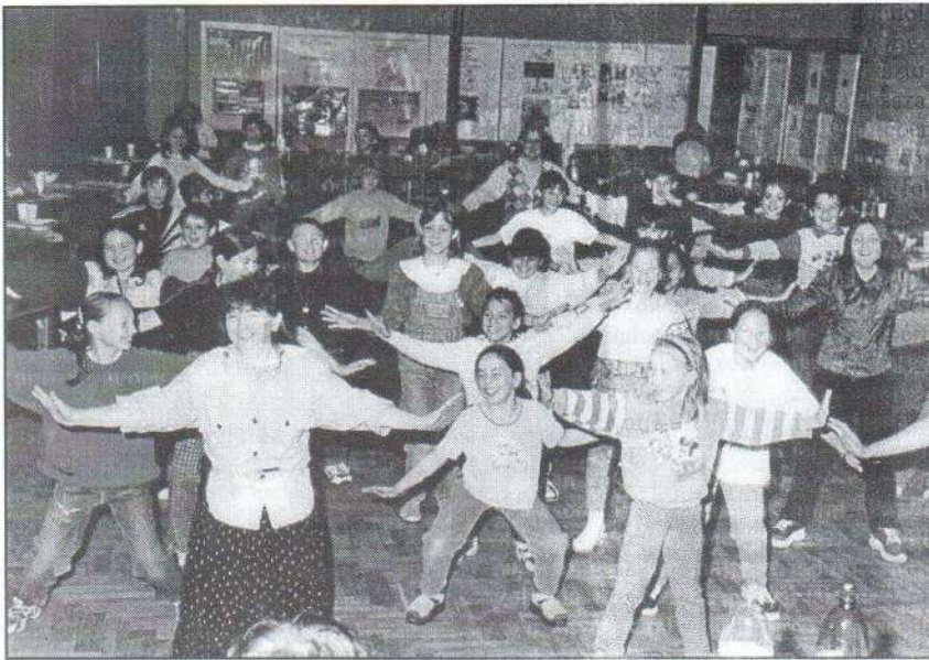
Amíg a zsűri tanácskozik, lazítanak a versenyzők

A Bedekovich Lőrinc Népfőiskolai Társaság kezdeményezésére többfordulós egészségnevelési vetélkedő zajlott az elmúlt tanévben. Az alsó tagozatos tanulóknak május 22-én, a felsősöknek június 5-én tartották a döntőt. A győztesek jutalma egynapos jutalomkirándulás volt.