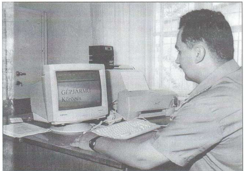
Május óta számítógép is segíti a jászfényzarui Rendőrőrs munkáját. Az alapgépet az önkormányzat vásárolta, a monitor és a nyomtató a Samsung Electronics-Magyar Rt. ajándéka.

A már meglévő ékszerekről érdemes fényképet készíttetni. Sajnos a tárgyleírások nem mindig pontosak. Az ékszerek adatait ajánlatos feljegyezni egy