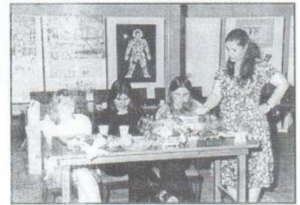
A felső tagozatosok egyik csapata

A Bedekovich Lőrinc Népfőiskolai Társaság kezdeményezésére többfordulós egészségnevelési vetélkedő zajlott az elmúlt tanévben. Az alsó tagozatos tanulóknak május 22-én, a felsősöknek június 5-én tartották a döntőt. A győztesek jutalma egynapos jutalomkirándulás volt.