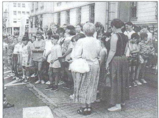
Programmegyeztetés a Gödöllői Agrártudományi Egyetem előtt