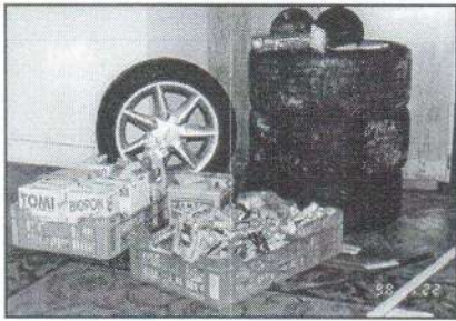
Fent és lent: betörésből származó tárgyak

Minden esetben valamilyen szinten a sértettek is hozzájárultak ahhoz, hogy éppen oda törjenek be. Miért mondom ezt? Mert sok esetben régen nem látogatott, ráccsal, biztonsági zárral el nem látott helyiségekbe