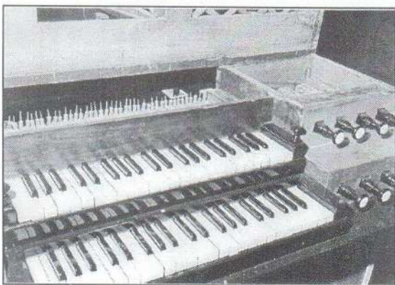
Az orgona klaviatúrája a regisztergombokkal.