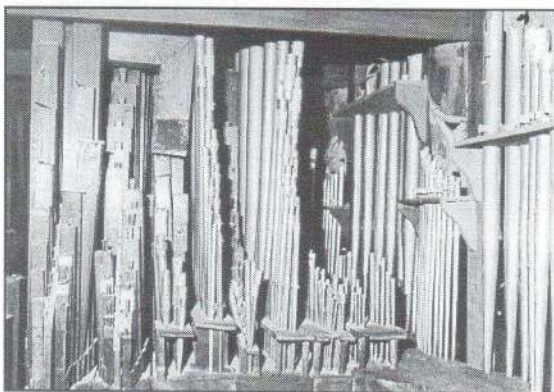
Az alsó manuál és pedál síprendszere.

A hangszer szabatos meghatározása: két manuálos, pedálos, rövid ambitusú (3 3/4 illetve 1 1/2 oktáv hangterjedelmű) mechanikus csuszkaladás ajaksípos orgona. Szabad legyen ezt a definíciót kissé megmagyaráznom: a két manuál a két fekete-fehér billentyűsört (klaviatúrát) jelenti egymás felett