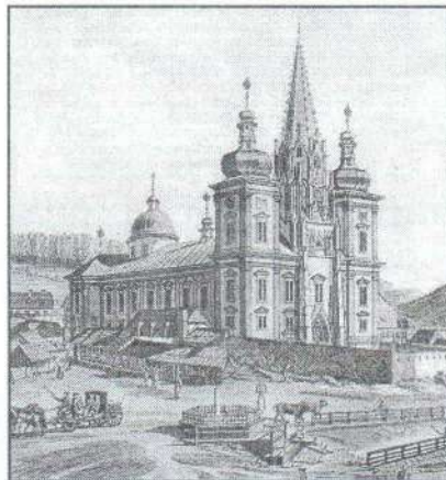
Metszet a celli templomról

Máriacell jelentőségét, hogy a világ évszázadok óta ismeri és magasztalja. Nagy boldogság töltött el amikor megtudtam, hogy immár ősz fejjel, eljuthatok arra a csodálatos helyre.