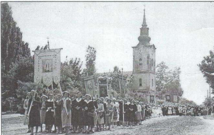
Ürnap körmenet Jászfényszarun 1956-ban.