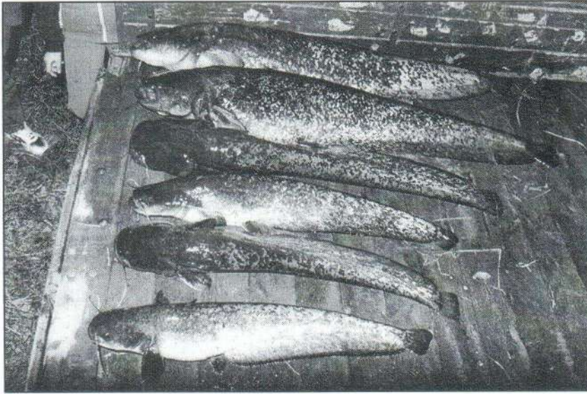
Egy nagy fogás. A harcsák összszúlya: 53,7 kg.

A jászfényszarui Béke Horgász Egyesület vezetősége a Magyar Országos Horgász Szövetség Szakszolgálatával az őszi telepítés előtt halállomány felmérést végeztetett 1996. október 31-én és november 1-jén.