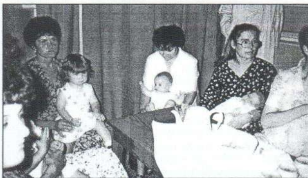
Kismamák, hiszabák a klubdelutánon.

Átlagosan tízzel nagyobb intelligencia hányadost (IQ) találtak ezeknél a gyermekeknél.