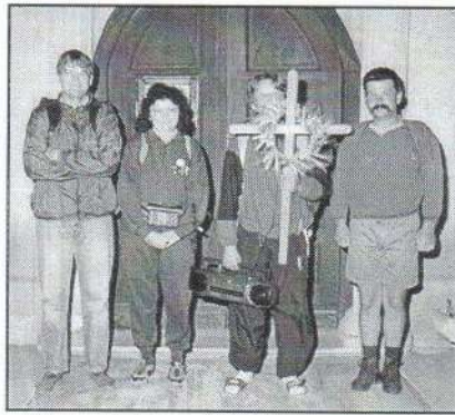
Mire a nap felkelt, már messze jártak...

Maroknyi csapatunk június 15-én hajnalban ismét gyalogosan indult a szentkúti búcsúra. A lelkesedést fokozta a kellemes idő, örömmel figyeltük a Nap felkeltét, s egy szép énekkel köszöntöttük. Hatvannál reggelit tartottunk, amely különösen jól esett, majd folytattuk utunkat a Zagyva