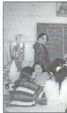
3. Ez a mi napunk. A... által szervezett vet...

„Sportolj velünk!” pályázaton a vándorkupát, megelőzve 17 iskola csapatát. A kupa mellé három futball- és egy kézilabdát is kapott iskolánk. Csapatunk minden sportágban, minden versenyen részt vettek, másodikos korosztálytól a nyolcadikosig.