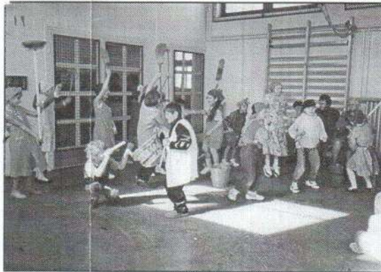
4. Ki mit tud? A 3. a „Tátika-paródiája”.

Érkező. Nyolcadikosaink új erőtől kezdhessek a választott iskoláikban, hogy izgalommal várják a tanévet, amely számukra új jelentést majd. Iskolánk diákeit „pihenik” egész