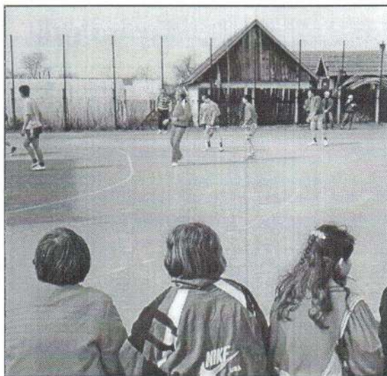
1. Fordított nap: tanár-diák meccs a Nagyskola udvarán.