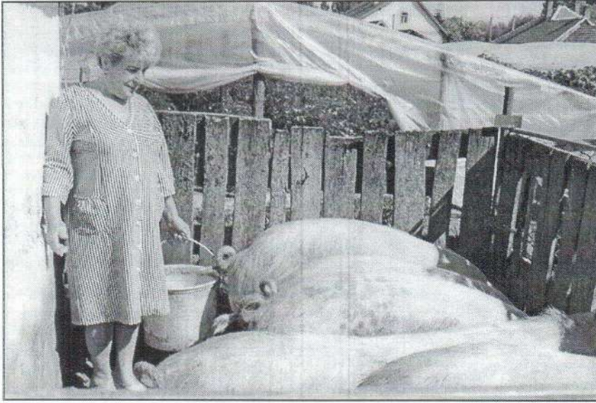
„A hízók nem eladók. Amit fizetnének érte, annyiért nem adhatom.”

„A fóliázást Kókán kezdtem '79-ben. Ott akkor ezt még senki nem csinálta. Előtte való évben költöztünk oda a fiammal, a házasságom ugyanis sajnos csődbe ment. Gondolkoztunk, mihez kezdünk? Ott volt a kert, a pihent föld, vettünk selejtvasakat, fóliát. Paradicsommal, uborkával próbálkoztunk. A palántákat is én neveltem, a termést helyben adtuk el. Már az első esztendő reményen felül sikerült.