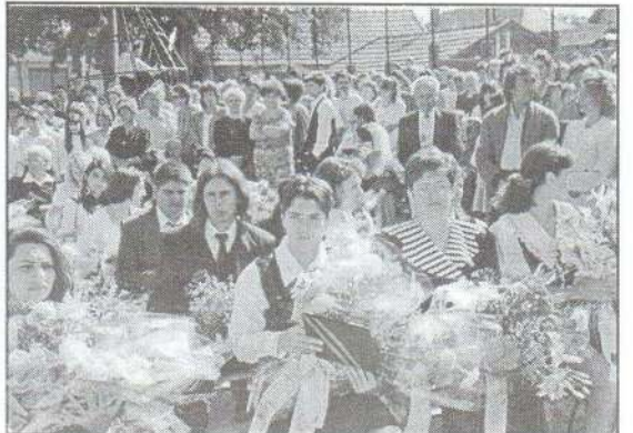
9. Ballagás – 1996