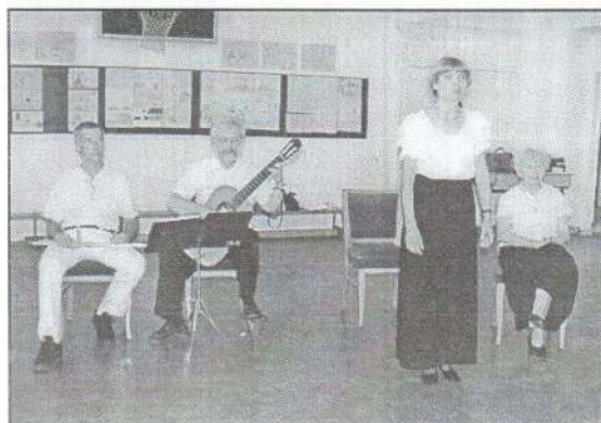
6. A budapesti Helikon Együttes...

Kimagasló eredmény született a sport területén, sportolóink idén immár másodszer nyerték el a Jászszági Diáksport Bizottság által meghirdetett