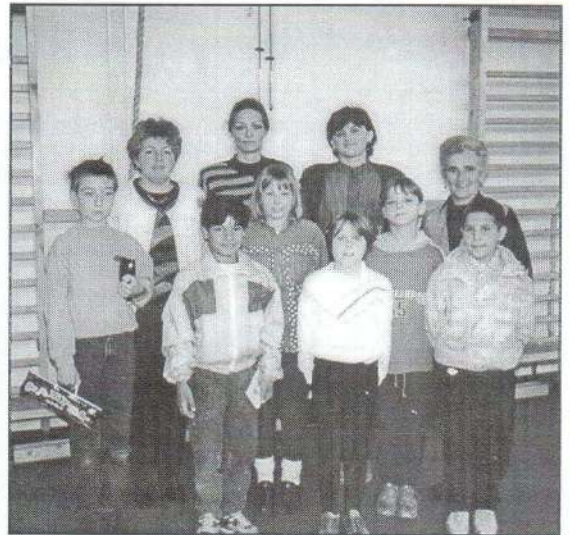
5. A millicentenáriumi alsós történelmi vetélkedő győztesei és a felkészítő nevelők.