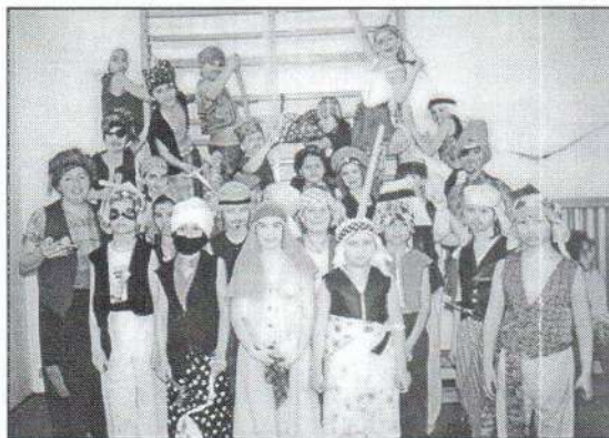
2. Ali baba és a 40 (-14) rabló a Farsangon.