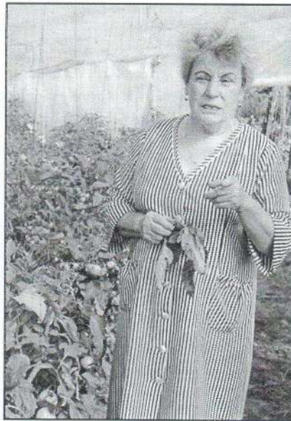
A paradicsomban mindig akad munka, locsolni, kocsolni való, még fényképezés közben is.

takarmányom is volt – négyet eladtam, vettem egy fagyasztószelekrényt, abba tettem az ötödiket. Mindig neveltem malacokat, anyadisznókat is. Most is van hat hízóm. A múltkor jöttek, érdeklődtek, mennyiért adom? Azt