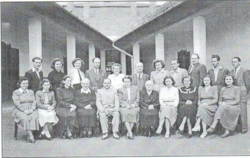
Kollégák között 1953. június 10-én.