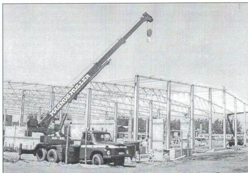
Beruházás a Samsung Rt.-nél, 1996 május.

Az építőközösségi szerződések benyújtásának határideje 1996. június 17-re módosul.