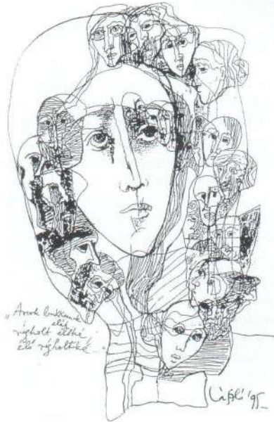
László Ákos illusztrációja

Aztán mégis megemlítettem, amire gondoltam. Az első ilyen közös nagy bemutató tavaly áprilisban volt Esztergomban.