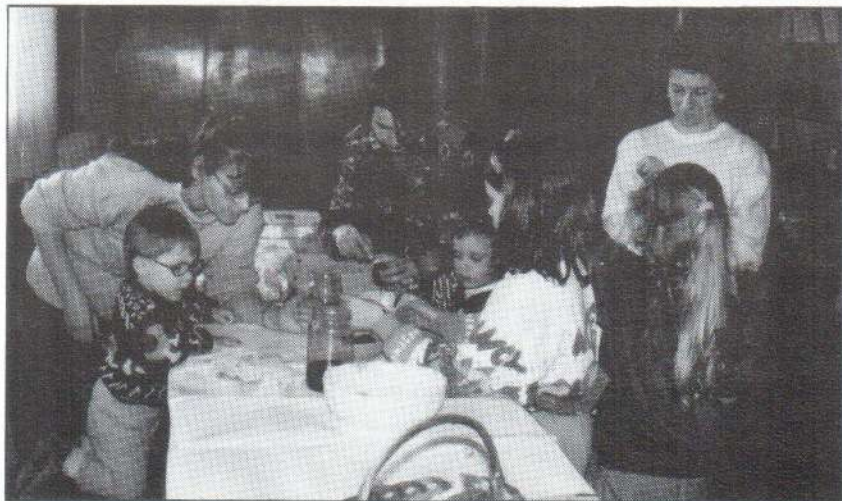
Húsvéti tojásfestés kicsiknek, nagyoknak. A Bedekovich Népfőiskolai Társaság gazdag tavaszi programjainak egyikén készült ez a felvétel.

Remélem, közös munkánk a diákokkal hasznos, eredményes és értéket hozó lesz!