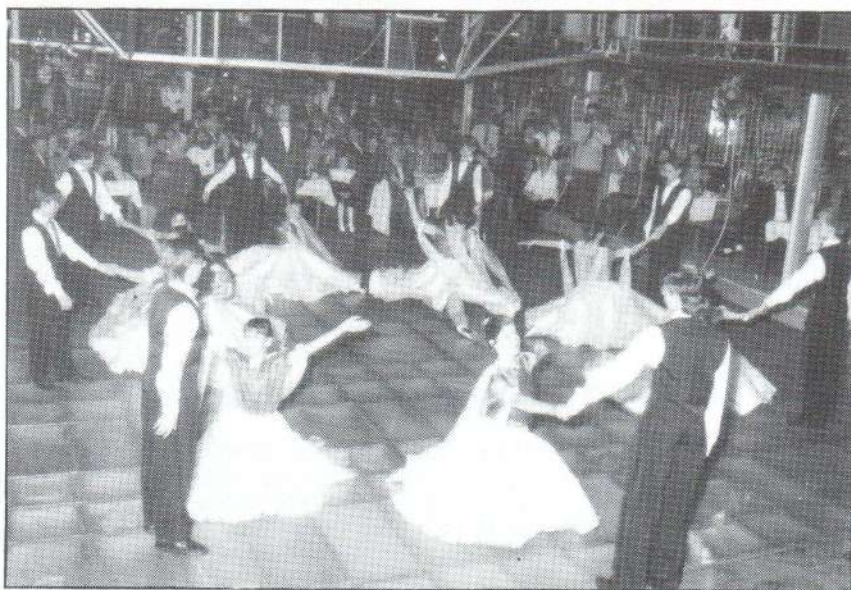
Visszapillantás a február 16-ai FÉBE-bálra. A képen a jászfény-szarui Társastánc-szakkör tagjai láthatók.