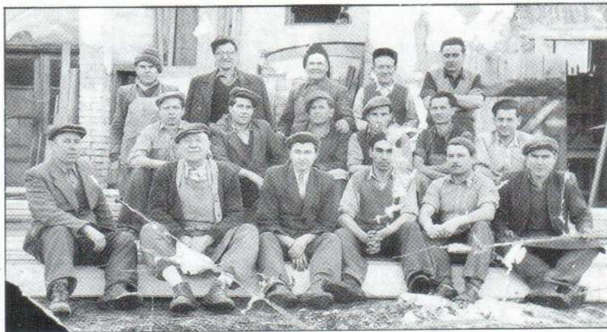
1955. február 26-án készült ez a fotó, melyen a jászfényszarui Vegyesipari Ktsz kezdő csapata látható. A képet Szűcs János (Kossuth L. u. 55.) ajándékozta a Városi Könyvtárnak. Köszönjük.