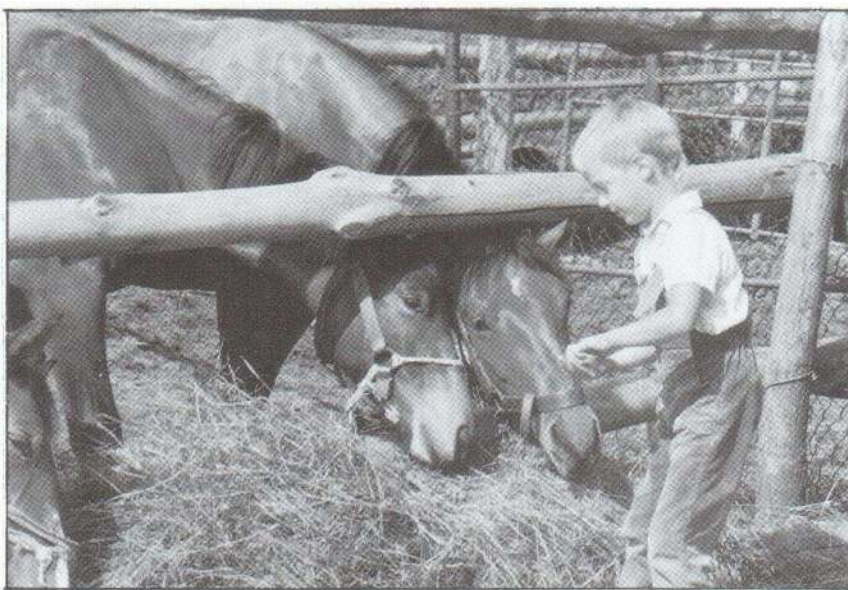
A gyerekeknek: romantika. Minden új állatot elneveznek, eladni csak szigorú beleegyezésükkel lehet.

- Elmondhatjuk, hogy tényleg egy nagy-családos gazdálkodást folytatunk. Azt viszont nem, hogy a mostani politika nagyban kedvezne a mezőgazdaságnak. Pedig, ha egy család vállalja, hogy eltartja magát, a mai viszonyok között egyáltalán nem kevés. Milliomosnak lenni nem lehet, meggazdagodni nem lehet, de megvan az az előnye, hogy nem kap az ember vegyszermérgezést, ami a növénytermesztés számos ágazatában előfordulhat. Milyen az életünk? Nehéz, mert egy tehenek nem mondhatom azt, hogy bocsánat, most