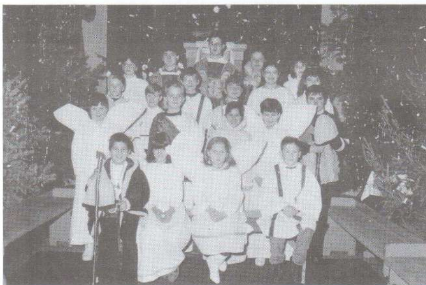
Szentestén immár hagyományá vált templomunkban a karácsonyi misztériumjáték. Felvételünk a gyermekszereplők csoportját örökítette meg december 24-én.