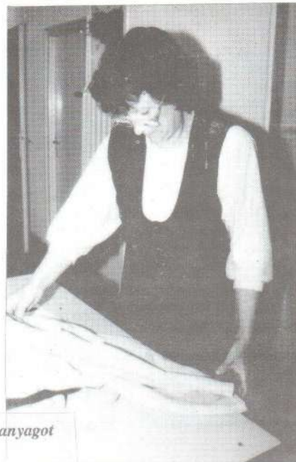
Képünkön már a kész vizsgaanyagot szemléli elégedetten az előadó.