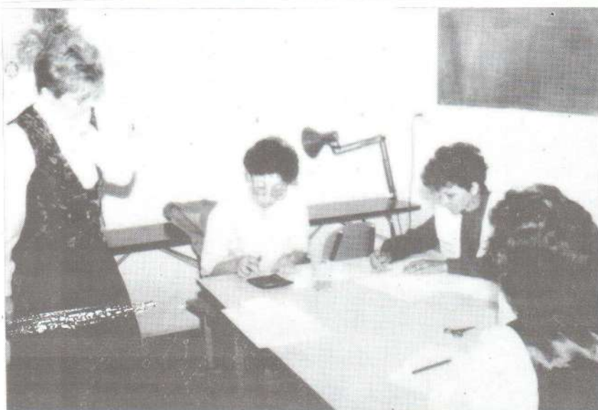
Fekvő képünkön a „nebulók” készítik vizsgamunkájukat.

Kérünk mindenkit, minél többen szépítsék épületeiket, környezetüket.