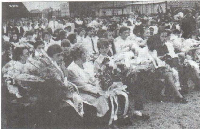
Ballagtak a nyolcadikosok