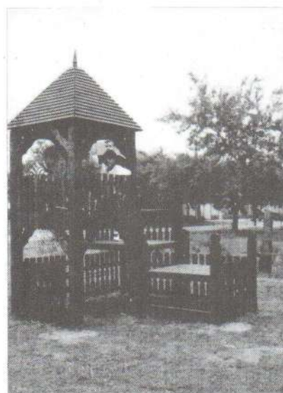
A gyerekek birtokukba vették a várat, a játszótér.