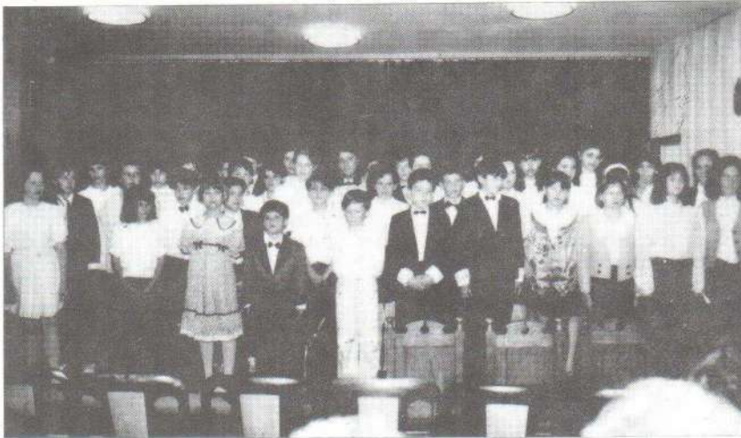
A „csemeték” előadás közben.