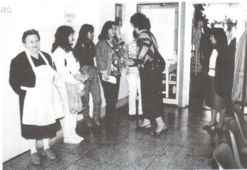
Egy régi és néhány új véréadó.