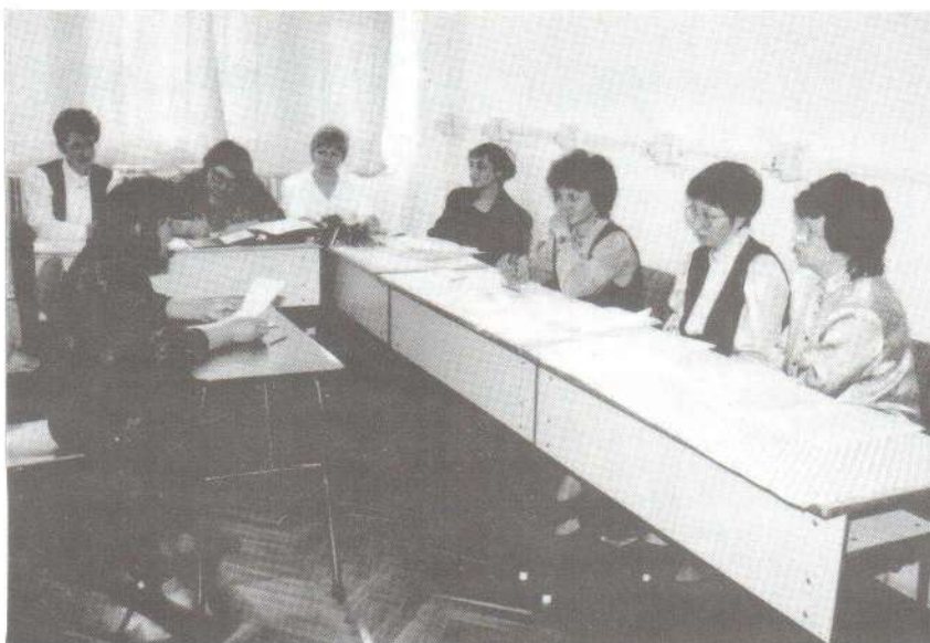
A vizsgabizottság előtt. Befejeződött a szakiskolában felnőttek részére indított textilvarró és ruhakészítő tanfolyam. Tizenhárom résztvevője vizsgázott sikeresen március 29-én.