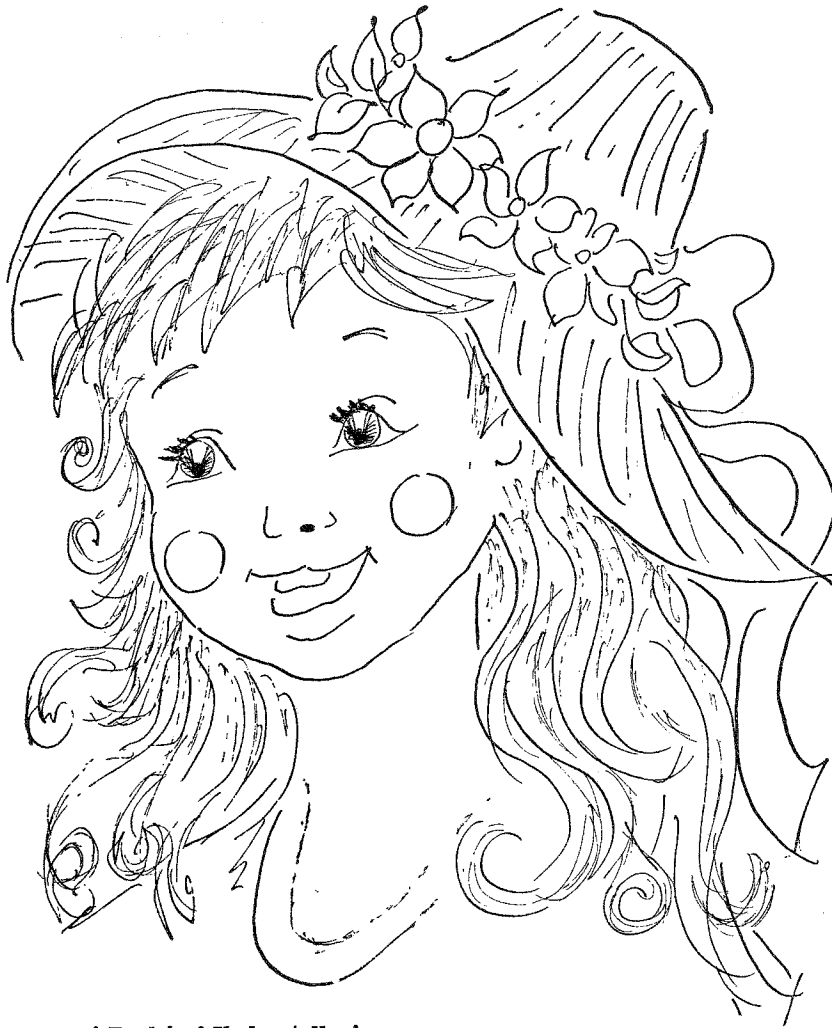
Ingesné Barkóczy Ibolya tollrajza