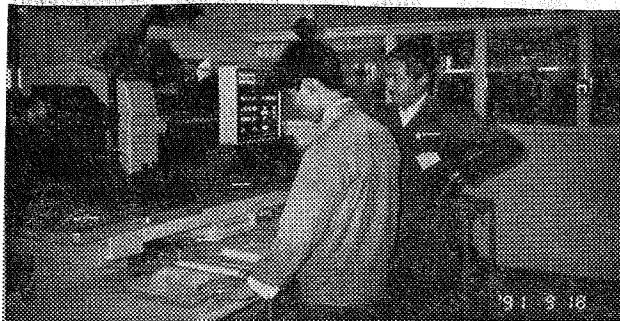
Az új szerelési műveleteket koreaiak tanítják.

Ez csak részben van így. Mint közismert tőkés cég rendkívül takarékos módon bánunk a munkaerővel, ezért egy nagyon kis mértékű létszám-bővítés és átszervezés az, ami a jelenlegi létszámunkat meghatározta. Ez a bővítés összesen annyit jelezett, hogy kb. 10—15 fővel bővült az egész gyár személyzete, és a