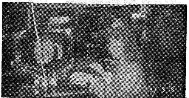
Talán éppen ez a készülék volt a száz ezredik.