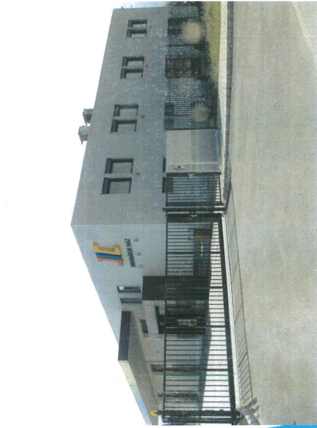
Inkubátor Ház (2020) STARTUP cégek

2018: „Tudományos és Technológiai Park” cím