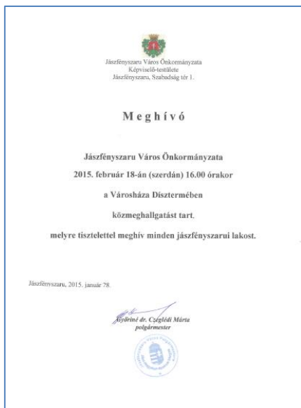
A Közmeghallgatás meghívója

A Közmeghallgatás januári meghirdetése és beszámoló a február 18-i eseményről az önkormányzati újság címlapján.