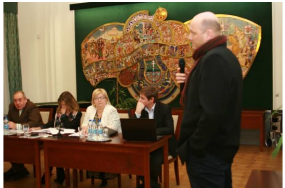
Előadások, majd vita a Közmeghallgatáson