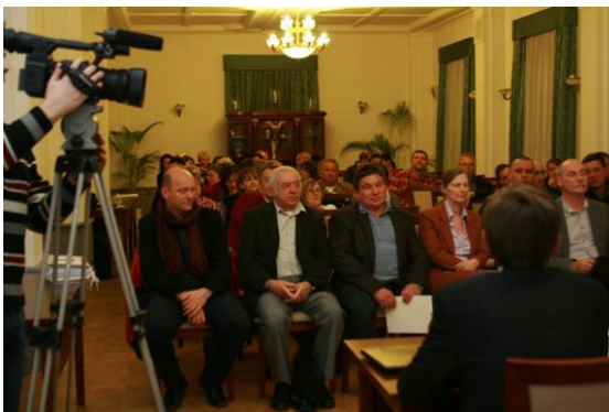
Képes és video anyag is készült