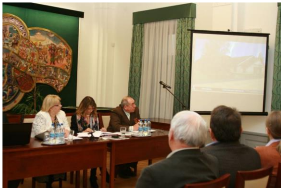
Előadások, majd vita a Közmeghallgatáson