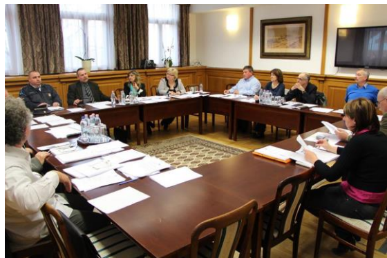
Képviselő testületi beszámoló