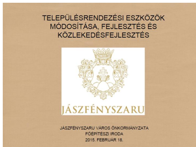
A Közmeghallgatás egyik kiemelt témája