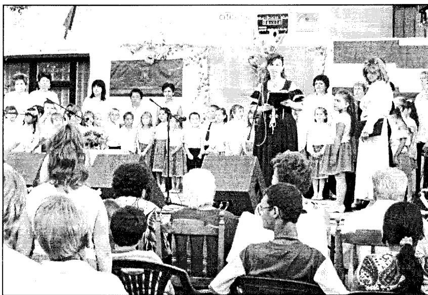
Városunkban augusztus 19-én került sor az államalapításunk tiszteletére rendezett ünnepségre. Beszámolónk a 3. oldalon olvasható.