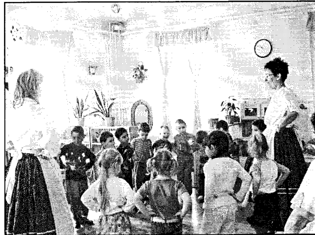
„Így kell járni...” Beszámoló a Napsugár Óvoda projektjéről (4. oldal)